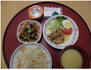
12月25日 クリスマス えびピラフ 鶏肉のマーマレード焼 海藻サラダ・コーンスープ サンタのおくりもの (いちごプリン)