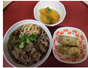
12月31日 大晦日 年越しそば ちくわの磯辺揚げ 南瓜の煮物