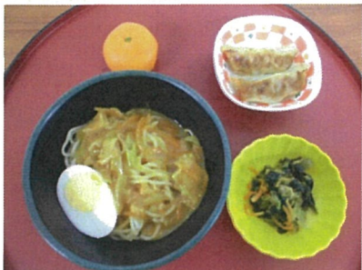
1月30日 ご当地グルメ （新潟県長岡市） カレーラーメン 小松菜のナムル 餃子・みかん