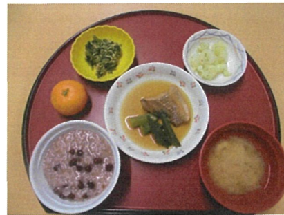
1月15日小正月 小豆粥 赤魚の煮付け 春菊の和え物 こぶき芋 味噌汁・みかん