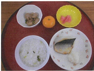
1月7日 七草粥 鮭の塩焼き 里芋そぼろ煮 漬物（桜漬け） みかん